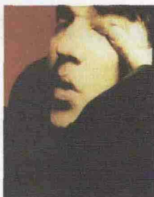
Il cantante Greg Dulli

Chitarrista e indomito apostolo di un rock che diventa sempre più raro, si rifà vivo Greg Dulli, nato 45 anni fa nell'Ohio. Personaggio inquieto, di quelli che nel rock cercano la salvezza, Dulli si ripresenta con una delle creature più longeve di una carriera mutante, i Twilight Singers, coi quali si esibisce mercoledì 6 al Magnolia (ore 22, 10 euro più tessera). Ex cantante