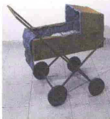
Opera di Perino & Vele

La carta, dal macero al museo. È un percorso inedito quello che Comieco, consorzio per il recupero e il riciclo di carta e cartone, propone dal 6 aprile a fine maggio. Mostre, concerti e iniziative culturali mostrano la versatilità della carta che da quaderno o rivista si trasforma in